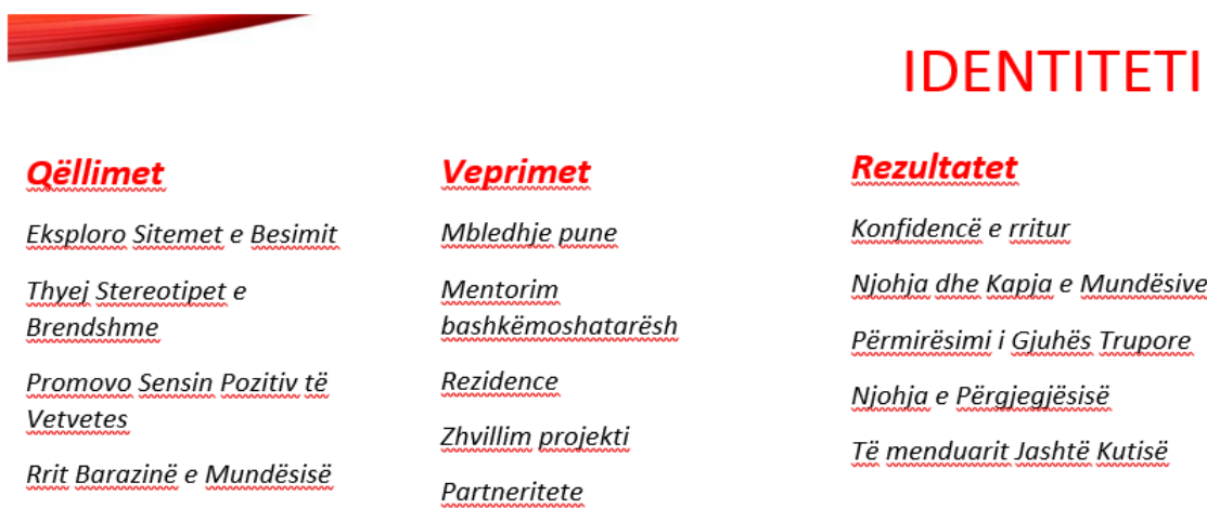
Figura 1: Identiteti dhe qasja e Hideaway

Projekti Hideaway fokusohet tek të rinjtë që marrin pjesë vullnetarisht në aktivitetet e projektit. Të gjithë të rinjtë, stafi dhe vullnetarët reflektojnë komunitetet lokale në zonë. Ruajtja është një prioritet në çdo kohë. Figura 1 më poshtë përmbledh identitetin Hideaway dhe fokusin e tij.